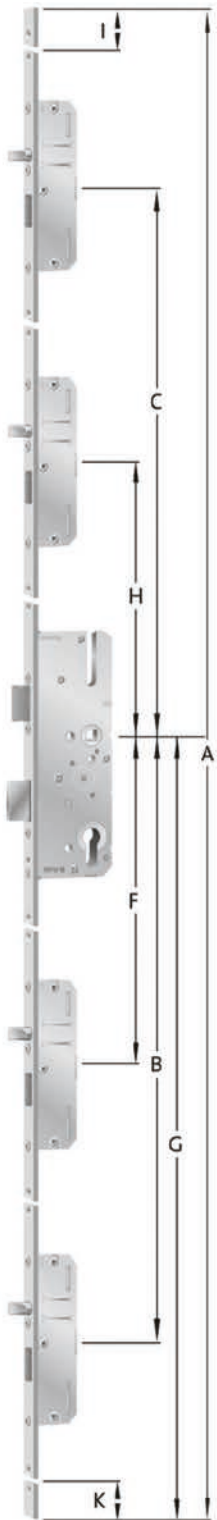
Schwenkriegel mit oder ohne Rundbolzen