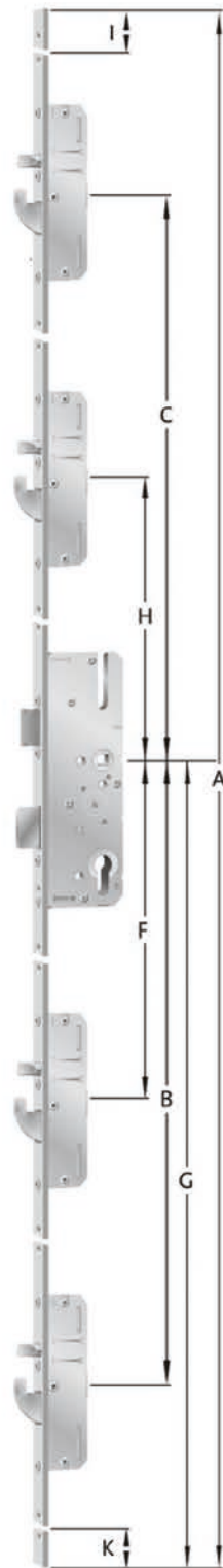
Schwenkriegel mit oder ohne Rundbolzen